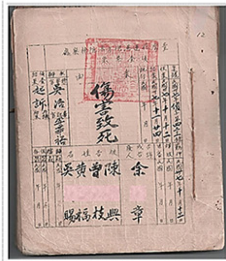
民國37年臺灣花蓮地方法院檢察處偵查卷卷面分別載有案號、收案日期、承辦檢察官、告訴人、被害等姓名及偵查結果。