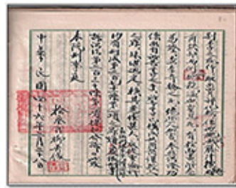
民國35年2月28日檢察官以九華字體所書寫之起訴書紙。