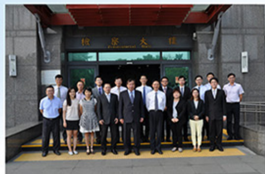
堅強的檢察官團隊

追訴犯罪、實行公訴及指揮刑事裁判之執行，乃檢察機關之主要工作，近年來本署案件增加，工作負荷沈重，惟全體同仁均能克盡職責，遵照上級指示積極辦理各類案件，尤以加強檢肅貪瀆、執行掃黑工作、嚴厲查緝毒品、全面查察賄選追緝電信詐騙、從速偵辦重大刑事案件、防制兒童及少年從事性交易行為、保護智慧財產權、取締經濟及電腦網路犯罪等，期能端正政風，澄清吏治；淨化選舉風氣，奠定民主政治根基使國人免再受到毒品之危害；確保民眾生命、自由、財產之安全。又秉承貫徹微罪不舉之政策，加強勸導息訟，以疏減訟源；恪守慎重聲請羈押之原則，以保障人權；另外也強化觀護、更生保護及犯罪被害人保犯罪業務，使誤蹈法網者得能遷善重生撫平被害人心靈；落實為民服務政策，增進民眾對檢察機關之信心。