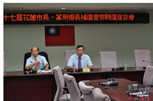
十七屆花蓮市長、黨鄉長補選巡察親臨座談會