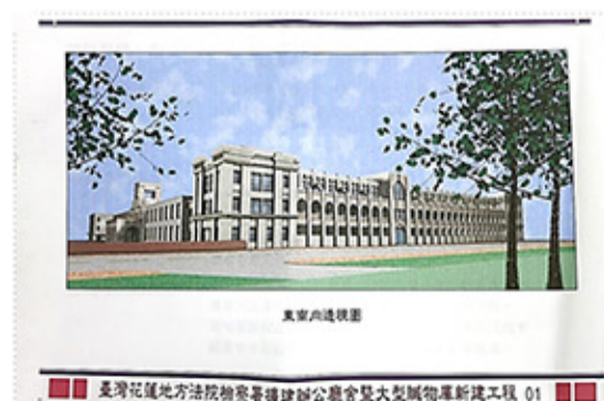
本署擴建辦公廳舍暨大型贓物庫新建工程之東南向透視圖