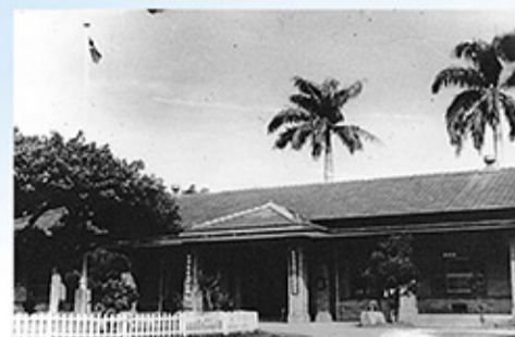
花蓮地方法院舊辦公廳正面

民國69年7月1日審檢分隸，民國79年6月12日本署辦理辦公廳舍增建工程，於民國79年6月21日發包，80年4月27日啟用。民國88年2月間經行政院審核「法務部所屬各級檢察署擴建辦公廳舍六年計劃」，同意本署擴建辦公廳舍暨大型贓物庫興建工程，於91年2月25日由張檢察長佩珍主持擴建動土典禮，整建搬遷等工程歷經陳檢察長文禮及郭檢察長文東前後任4位檢察長之努力，於93年8月30日完成。