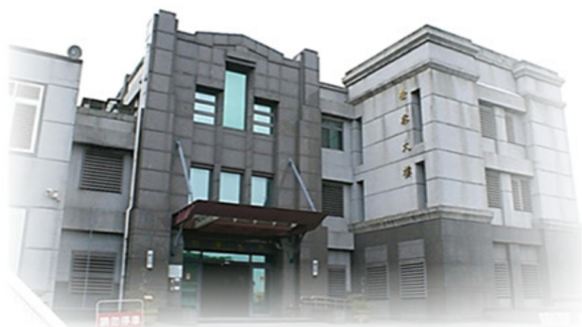
擴建檢察大樓外觀