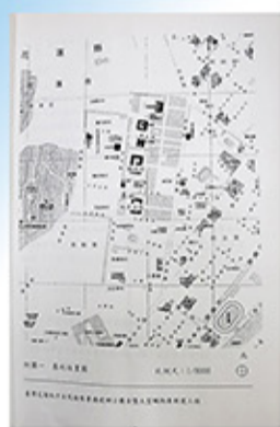
本署擴建辦公廳舍暨大型贓物庫新建工程之基地位置圖