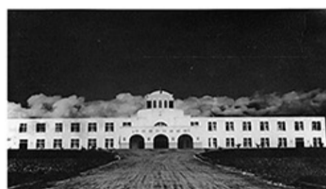
花蓮地方法院新辦公廳正面