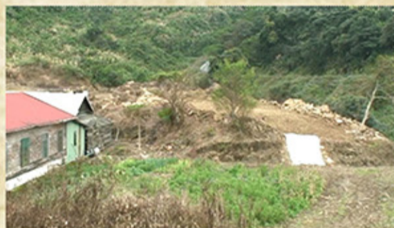
被告非法竊佔公有山坡地，使山坡地裸露(民國98年)

民國98年被告詹○○等十餘人明知花蓮縣卓溪鄉清水農場土地均為政府核定公告之山坡地範圍，屬水土保持法之山坡地，非經主管機許可，依法不得整地，竟意圖為自己不法利益，未經許可共同擅自占用該土地，非法伐木、除草、整地、設置工寮、開挖水池、拓寬農路，並種植青椒、生薑、茶葉、檳榔等作物，造成10餘公頃（即10萬平方公尺）之廣大森林嚴重損害，案經王怡仁檢察官偵結提起公訴，分別被判處有期徒刑6月至2年5個月刑期定讞。