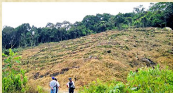
花蓮縣卓溪鄉清水農場國有地遭竊佔、嚴重荒置，多處已呈現光禿景象