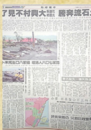
90年7月31日(中國時報)版報第