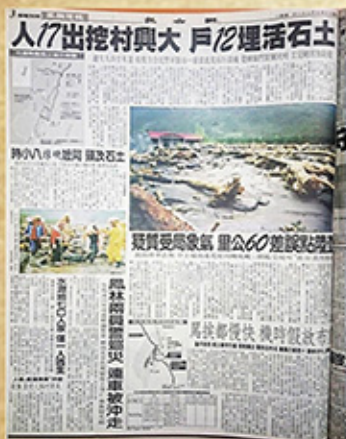
90年7月31日(日新日報)版報第