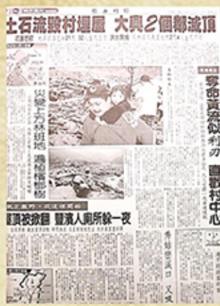
90年7月31日(自由時報)版報第