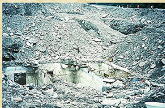
光復鄉大興村遭土石掩埋照片(民國90年)