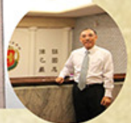
專案小組召集人兼主任檢察官蔡清祥 (現任法務部司法官學院院長)