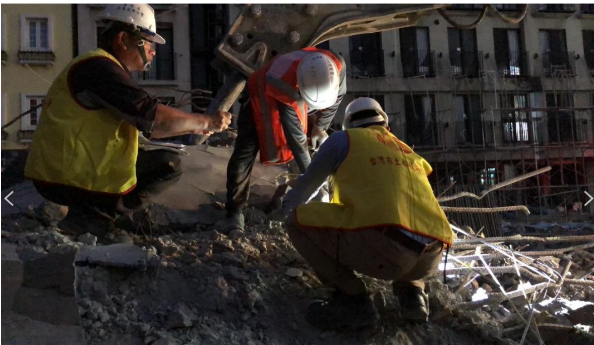
取證作業不分晝夜持續進行