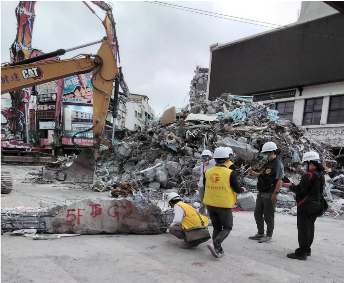
本署檢察事務官會同技師進行鋼筋取樣作業，警方在旁全程錄影